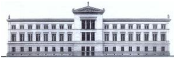
Das Neue Museum nach A. Stülers Original-Plänen